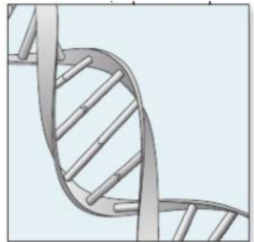
Modelo de Watson y Crick que muestra el DNA en la forma de doble hélice.

Casi al mismo tiempo, los científicos James Watson y Francis Crik trabajan en un proyecto para averiguar también la estructura del ADN. Basándose en el trabajo de otros científicos, hipotizaron que el ADN debía tener una forma helicoidal. Se basa en que Wikins, en 1953, había mostrado a Watson la famosa "Fotografía 51", sin el permiso de Franklin, y dicha información, proporcionó a Watson y Crik una de las últimas claves para poder completar su modelo de la estructura del ADN.